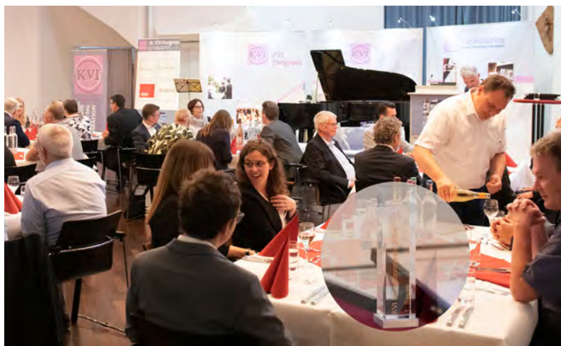
Abb.: interim2000 GmbH/Patricia C. Lucas

Das diesjährige Programm finden Sie unter https://kvikongress.de/programm2024.html