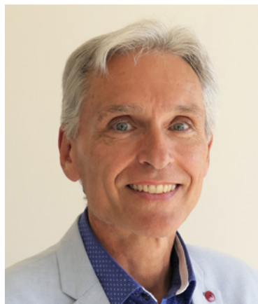
Peter S. Nowak, Herausgeber: Peter S. Nowak, Herausgeber: „Moderne Verwaltungen - Von der Vision zur Realität“ lautet das Motto des diesjährigen KVI Kongresses, der seinen 20ten Geburtstag feiert. Seien Sie dabei und feiern Sie mit.“